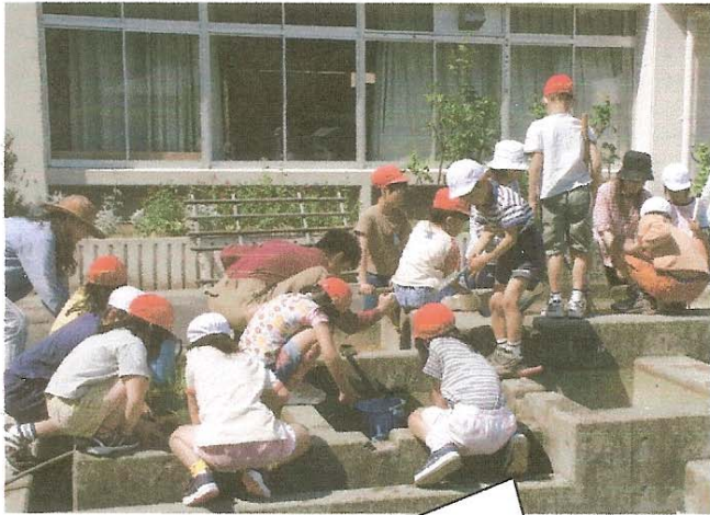
水生植物も植えたよ